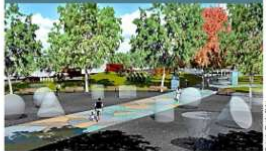
» El museo contará con plazas de descanso.

un foro al aire libre formado por depresiones y elevaciones de la topografía natural. » Las áreas temáticas se articularán de forma longitudinal por medio de plazas de transición.