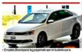
El modelo Volkswagen se ha presentado en un stand que se encuentra en la feria de Puebla.